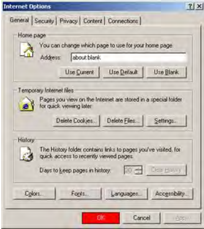
Internet Explorer 6