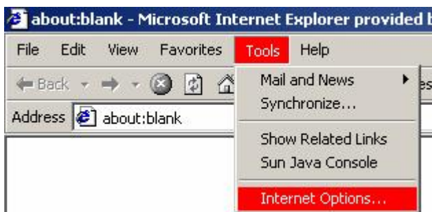
Internet Explorer 6