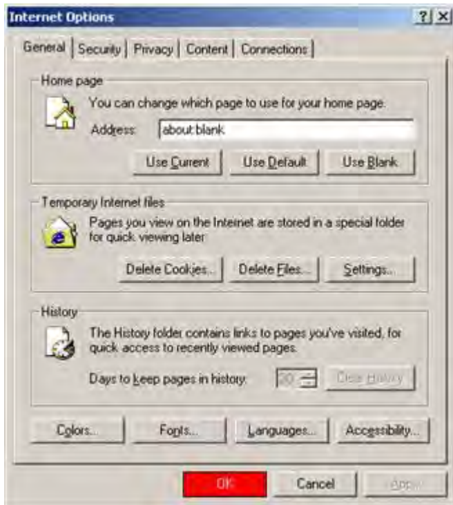
Internet Explorer 6