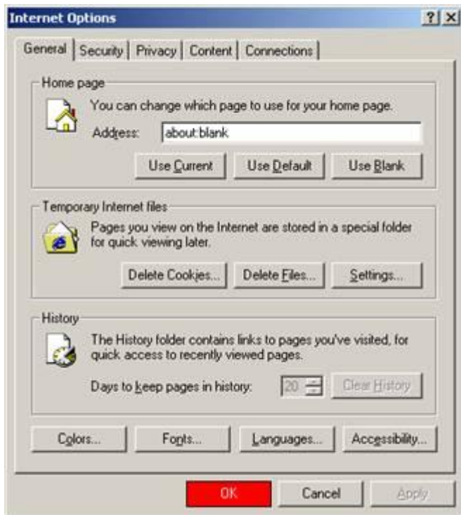
Internet Explorer 6